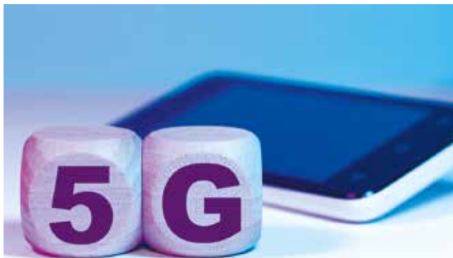
Les champs électromagnétiques pulsés sont les plus nocifs sur la santé (c'est le cas du wifi, des téléphones portables, des DECT, du Bluetooth, du courant CPL et du Linky, de la 3G, 4G et, bien plus que tout, de la 5G).

ICNIRP : Commission internationale sur la radioprotection non ionisante. Elle conseille sur les risques sanitaires liés à l'exposition à la radiation non ionisante. Commission très controversée du fait des liens de nombreux de ses membres scientifiques avec l'industrie des télécommunications.