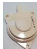
Module télé report